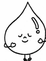
ロタウイルスワクチンちゃん

だから、感染しても重症化しないように、ワクチンを接種しましょう！ ロタウイルスワクチンは飲むワクチン。薬の種類によって、2回または3回接種します。